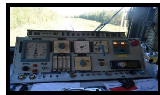
Lärare i ATC-, fordons- och bromsteknik